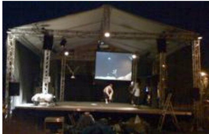
Répétitions le 19 juin 2009, Dole, Mesnils pasteur...

Benoît Humbert benoit@lacarotte.org ; 06 73 20 46 68 Ou Chloé Latour chloe.latour@gmail.com ; 06 26 61 41 44