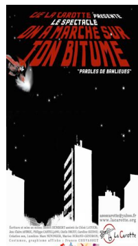
Affiche du 20 juin 2009...