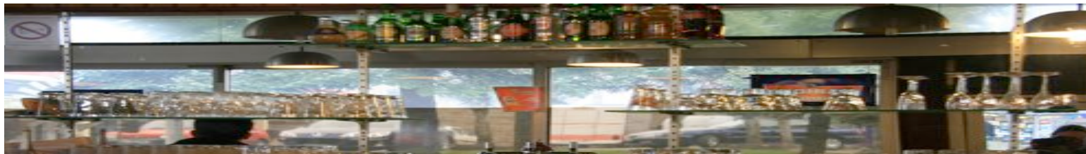
Le bar des Mesnil